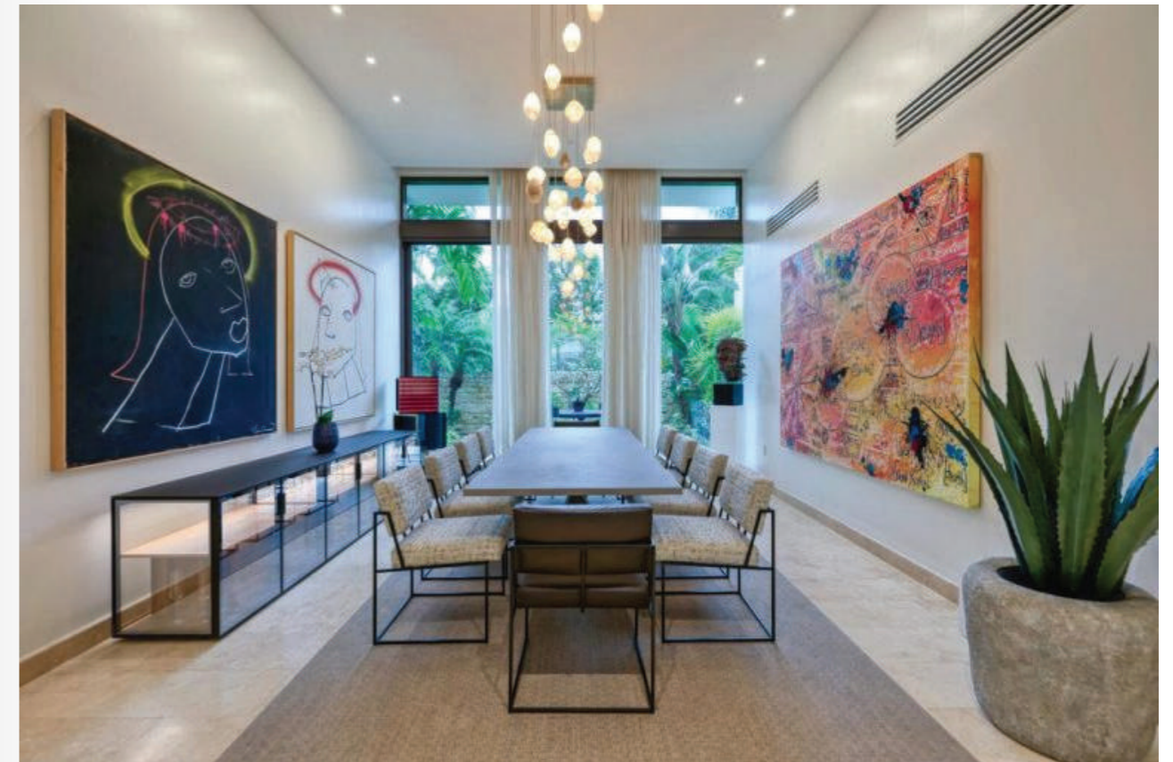
Phòng ăn trang trọng

Tất cả người sống ở đó đều có nhân viên hỗ trợ sắp xếp mọi thứ, từ liệu trình thư giãn tại spa đến đặt chỗ nhà hàng bên ngoài cho đến dịch vụ dọn phòng hoặc ăn uống trong khu dân cư. Người mua cũng có quyền truy cập vào chương trình cho thuê của khu nghỉ dưỡng đồng thời khu nghỉ dưỡng sẽ xử lý mọi thứ để bạn không cần phải làm bất cứ thứ gì.