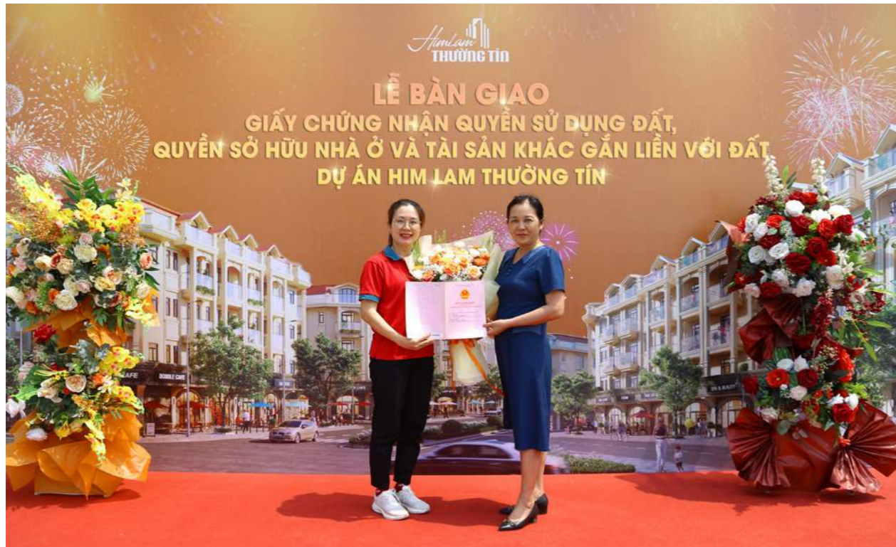
Đại diện chủ đầu tư bàn giao sổ hồng cho cư dân.

Việc bàn giao sổ hồng vượt tiến độ là kết quả sau những nỗ lực và tâm huyết của chủ đầu tư Him Lam Thường Tín trong suốt thời gian qua. Đây chính là bảo chứng đảm bảo cho chủ sở hữu được hưởng các quyền hợp pháp theo đúng luật nhà ở; góp phần gia tăng giá trị bất động sản bền vững.