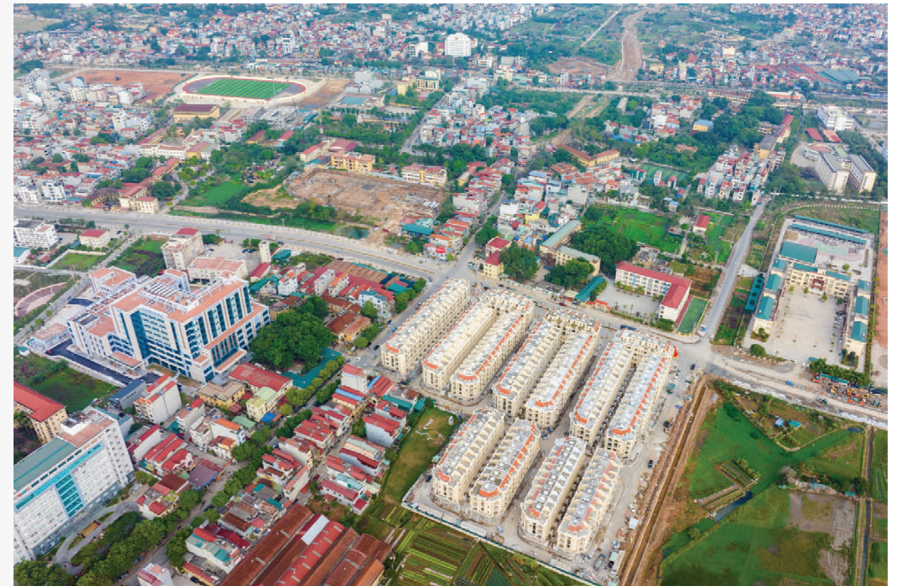
Phân khúc nhà thấp tầng tại Thường Tín "hút" giới đầu tư

Với những lợi thế phát triển công nghiệp, hạ tầng, quy hoạch, các chuyên gia đánh giá, thị trường bất động sản Thường Tín sẽ là cực tăng trưởng trong thời gian tới. Đặc biệt, giá nhà đất tại Thường Tín sẽ có cơ hội bứt phá khi sắp lên quận, tương tự câu chuyện tăng giá tại các thị trường bất động sản khi chuẩn bị lên quận như Đông Anh, Gia Lâm, Hoài Đức vài năm trở lại đây.