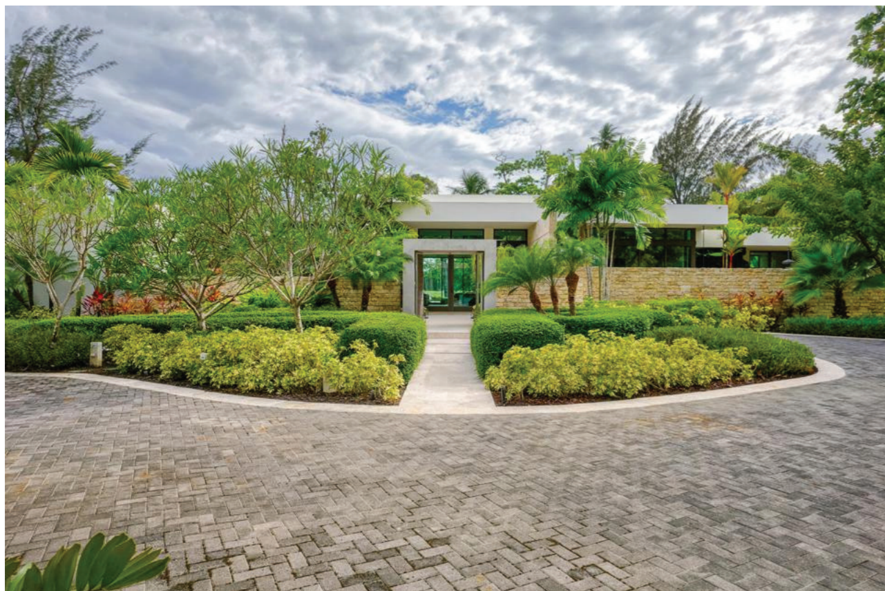
Lối vào ngôi nhà

Ngoài ra kể từ sau cơn bão Fiona, nhiều công ty phát triển bất động sản cùng với nhà đầu tư tiến hành xây dựng lại hòn đảo này với nhiều ngôi nhà sang trọng cũng như mua tài sản từ người dân địa phương.