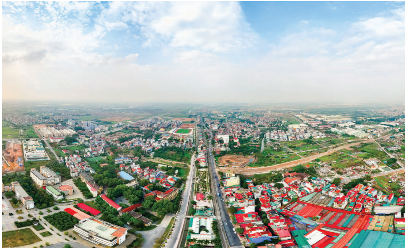
Một góc huyện Thường Tín

Cùng với những tuyến cao tốc này, vành đai 4 sẽ là trục phát triển quan trọng thúc đẩy sự phát triển của Thường Tín khi có chiều dài 58,2km, đi qua 7 quận huyện gồm: Sóc Sơn, Mê Linh, Đan Phượng, Hoài Đức, Thanh Oai, Thường Tín và quận Hà Đông. Năm 2024, đường Vành đai 4 - Vùng Thủ đô là một trong những dự án trọng điểm quốc gia được thành phố tập trung triển khai.