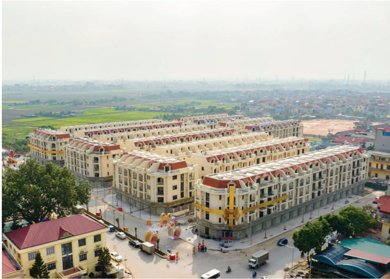
Các dự án khu Nam đang được nhiều nhà đầu tư "sẵn đón".

Dự báo về xu hướng phát triển của bất động sản Nam Hà Nội, Savills Việt Nam từng cho biết từ 2024 trở đi, khu vực Thanh Trì, Thường Tín sẽ là một trong các thị trường bất động sản của Hà Nội với khả năng tăng trưởng cao. Mức giá thấp cho thấy sự chưa hấp dẫn của bất động sản phía Nam trong quá khứ. Tuy nhiên, trong tương lai chúng ta thấy sẽ có sự thay đổi rõ rệt, mặt bằng giá sẽ gia tăng nếu hạ tầng được đầu tư đúng như kế hoạch.