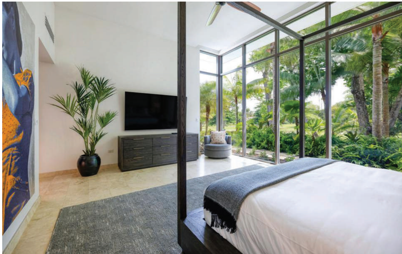
Mỗi phòng đều có thể ngắm khung cảnh thiên nhiên ngoài trời.

Ngôi nhà hiện đại nép mình trong một khung cảnh tươi xanh, tràn ngập các loài thực vật nhiệt đới bản địa cùng với những cây cọ cao chót vót đung đưa trong gió. Để đi vào nhà, bạn lái xe chạy qua một đường vòng, sau đó thẳng trên con đường rợp bóng cây dẫn đến cửa trước.