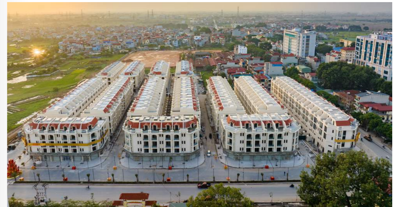
Đại diện chủ đầu tư bàn giao sổ hồng cho cư dân.

Bao quanh dự án là "hệ sinh thái tiện ích" đa dạng như: Bệnh viện Đa khoa, UBND Huyện, Trường THPT Thường Tín, Trường THCS Nguyễn Trãi A, Trường Cao Đẳng Truyền hình, Ga Thường Tín, Đội PCCC,... Từ Him Lam Thường Tín, cư dân có thể tiếp cận với đầy đủ các dịch vụ tiện ích cũng như dễ dàng tiếp cận với các cơ quan hành chính công trong khu vực.